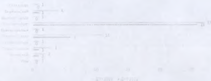
Территории, где зарегистрирован рост ДТП

40% (23) пострадавших и погибших в ДТП детей приходится на среднее школьное звено, 39% (22) на начальную школу и 21% (14) на дошкольный возраст, при этом большая часть пострадали и погибли в качестве пассажиров транспортных средств