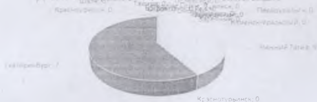
ДТП по субъектной ответственности детей

Принимая во внимание результаты дифференцированного анализа детского дорожно-транспортного травматизма.