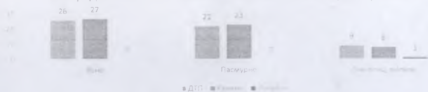
Распределение показателей в зависимости от погодных условий

54% ДТП (31) произошли при неблагоприятных метеорологических условиях (пасмурно, снегопад, метель) и 46% (26) при ясной погоде. Неблагоприятные погодные условия косвенно могли повлиять на возникновение ДТП с участием детей, так как ухудшается видимость, возрастает тормозной и остановочный путь у транспортных средств