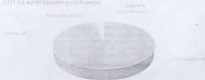
ДТП по категориям участников

Причинами подавляющего большинства происшествий стали грубые нарушения ПДД РФ водителями транспортных средств (превышение скоростного режима, выезд на полосу встречного движения, несоблюдение правил проезда пешеходных переходов).